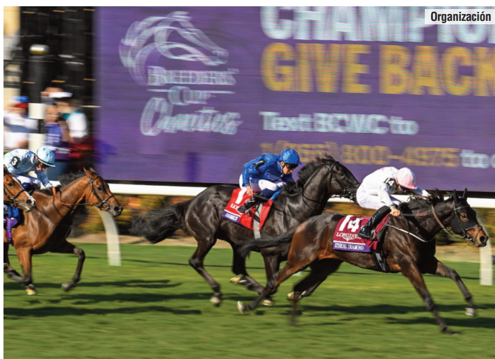
Ethical Diamond , un 28 a 1 de Mullins que venció en los 2400 metros de la BC Turf.

En la última prueba de la reunión, la BC Filly & Mare Turf , de nuevo cinco de las seis primeras favoritas eran europeas, junto a la norteamericana She is Pretty (Karakontie, 33/10): Cinderella's Dream (Shamardal, 31/10 F), Diamond Rain (Shamardal, 47/10) y la Gezora (Almanzor, 91/10), las dos primeras de Godolphin. La tercera, tras haber sido segunda en el Vermeille, venía de correr mal en el Arco. Velázquez hizo el recorrido con She is Pretty en una excelente posición cerca de la cabeza y nada más