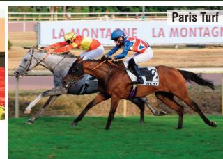
Su victoria del campeonato en Vichy.

“A diferencia de otros años, esta edición ha sido más corta, comenzó más tarde y ha estado más concentrada. Afortunadamente, he contado con caballos con buenas probabilidades durante todo el campeonato en una edición con jinetes nuevos, con mucha energía y con ganas de crecer. Las victorias en San Sebastián y Vichy me ayudaron mucho. Como cuando gané hace diez años, hasta la última carrera no había nada decidido y todo ha sido muy intenso hasta el final. Debo agradecer a la AEGRI, a todos mis compañeros de la cuadra y a mi familia el apoyo recibido”.