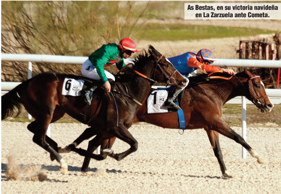
As Bestas, en su victoria navideña en La Zarzuela ante Cometa.