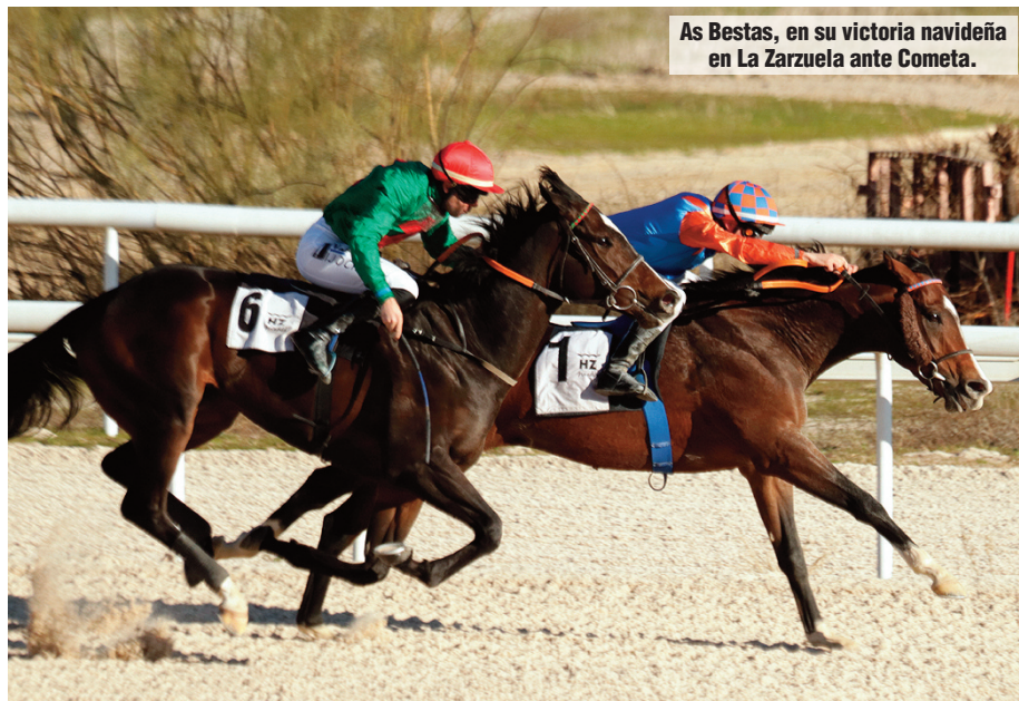
As Bestas, en su victoria navideña en La Zarzuela ante Cometa.