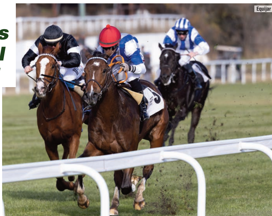
El Veil Picard del pasado 30 de noviembre con Time Tight.