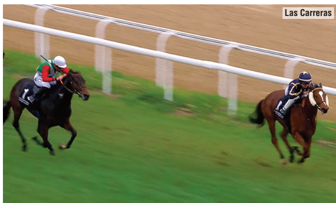
Running Hot dominó de salida a meta.