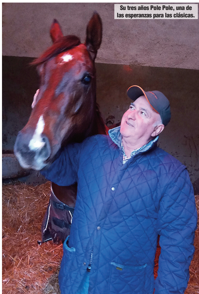
Su tres años Pole Pole, una de las esperanzas para las clásicas.