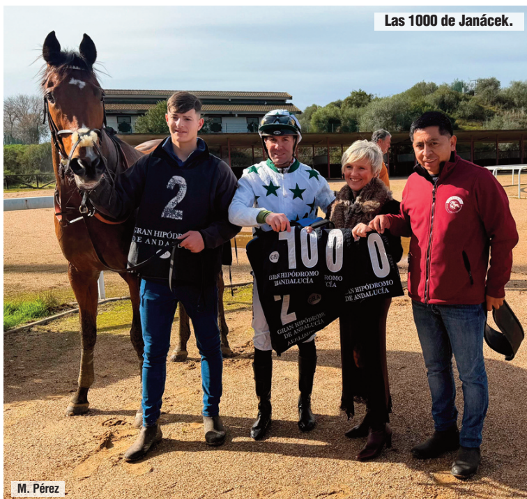
Las 1000 de Janáček.