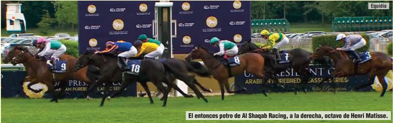
El entonces potro de Al Shaqab Racing, a la derecha, octavo de Henri Matisse.

Selección: Selenien Alternativa: Natural Force