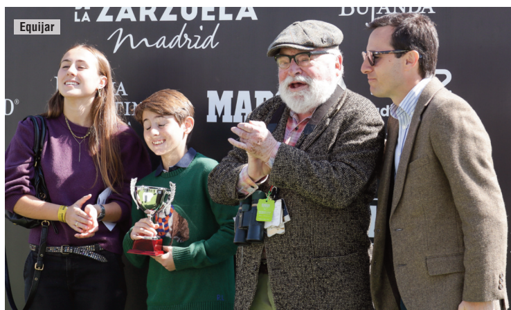
Fernando Savater entrega la copa de su premio a la cuadra Mediterráneo, propietaria de Majestad.