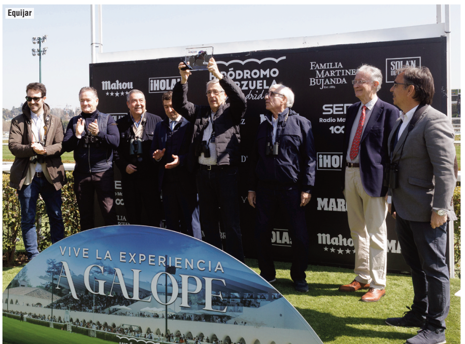
Sirjan fue elegido Caballo del Año 2025 por la prensa y la cuadra Cum Laude recogió su trofeo.