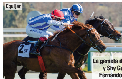
La gemela de Majestad y Shy Guy en el Fernando Savater.