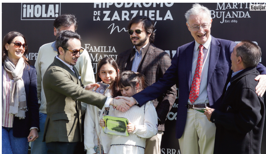
Sound of Freedom y Cielo de Madrid ganaron el premio de Francisco Salas.