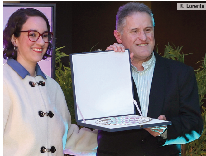
En una entrega de premios del Jockey Club Español.

Yo creo que los de antes. Hace 30-40 años había muchísimos caballos que estarían corriendo y ganando Listed y Grupo. Profesionalmente, puede ser que hubiera más talento y ahora, más que talento, hay más gente preparada porque han podido formarse más y trabajar en diferentes sitios. Antes era algo que te salía más natural, eras bueno porque era lo tuyo. Llegaba gente al hipódromo, sin muchos conocimientos y sin mucha cultura, se dedicaban a su oficio y tenían o no ese talento.