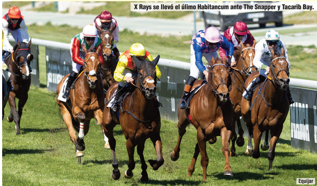
X Rays se llevó el último Habitancum ante The Snapper y Tacarib Bay.