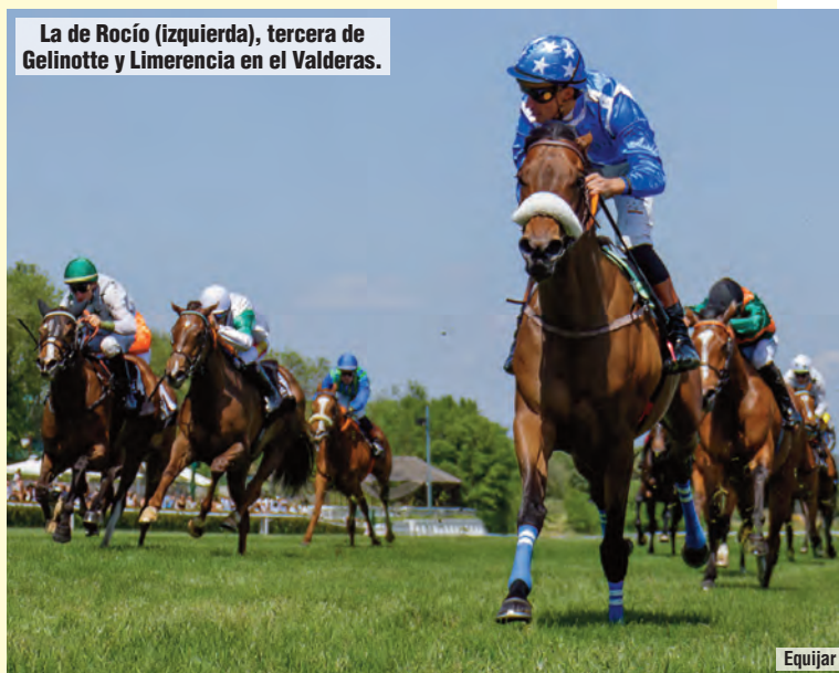
La de Rocío (izquierda), tercera de Gelinotte y Limerencia en el Valderas.