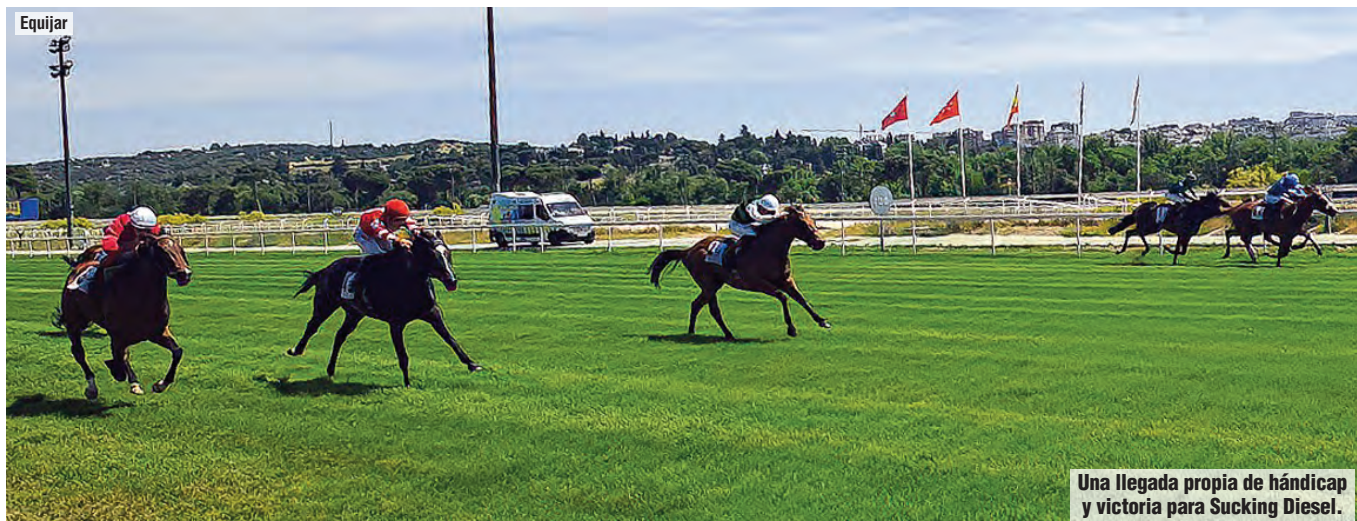
Una llegada propia de hándicap y victoria para Sucking Diesel.