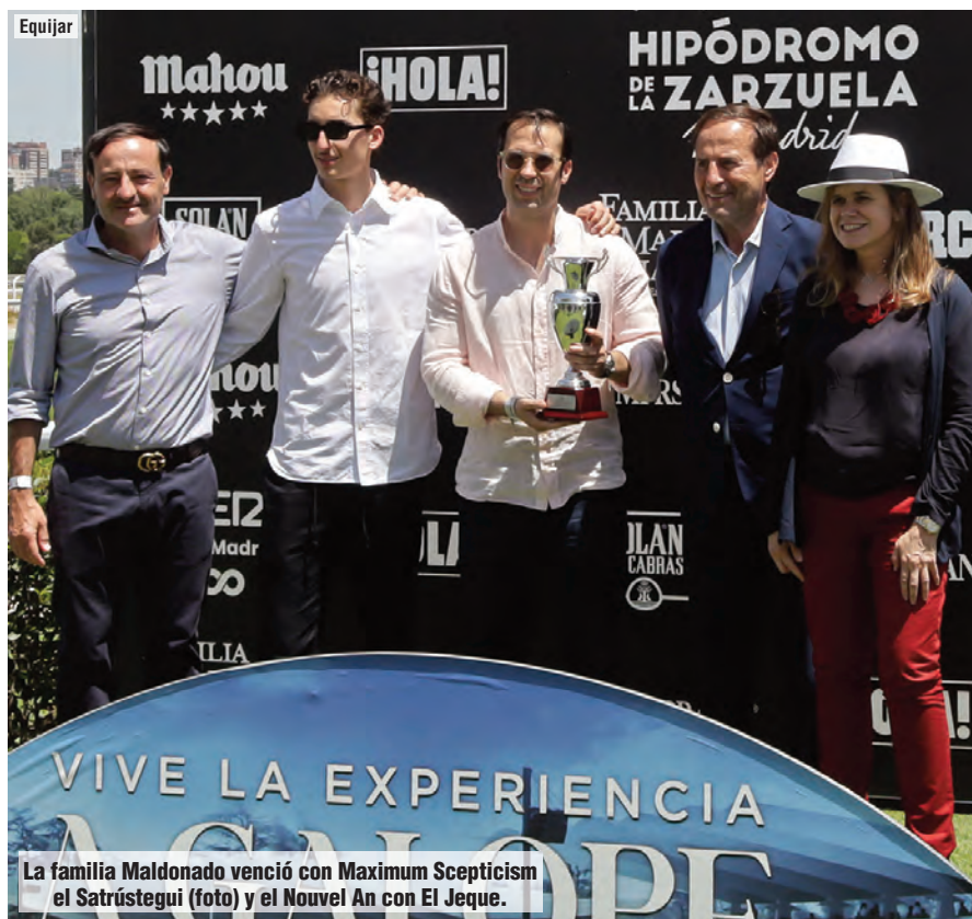
La familia Maldonado venció con Maximum Scepticism el Satrústegui (foto) y el Nouvel An con El Jeque.