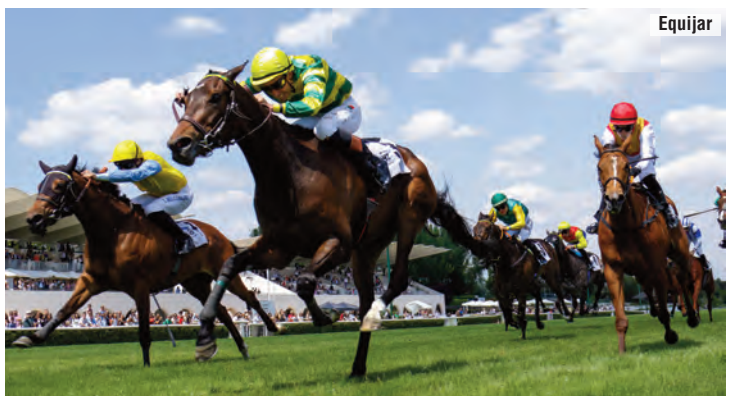
Segunda de Delicada la representante de Hermanos Mora Figueroa en la preparatoria.

La dinámica es más o menos la misma. No hay respuesta. Es verdad que se ha publicado el programa de carreras de otoño y mejora el de primavera, pero la situación de las instalaciones es similar a la de los últimos meses y años, desde que contamos con este presidente. No sé qué más se puede hacer para que recuperemos unas condiciones mínimas básicas para la salud de los caballos y de los mozos que trabajan en el hipódromo todos los días.