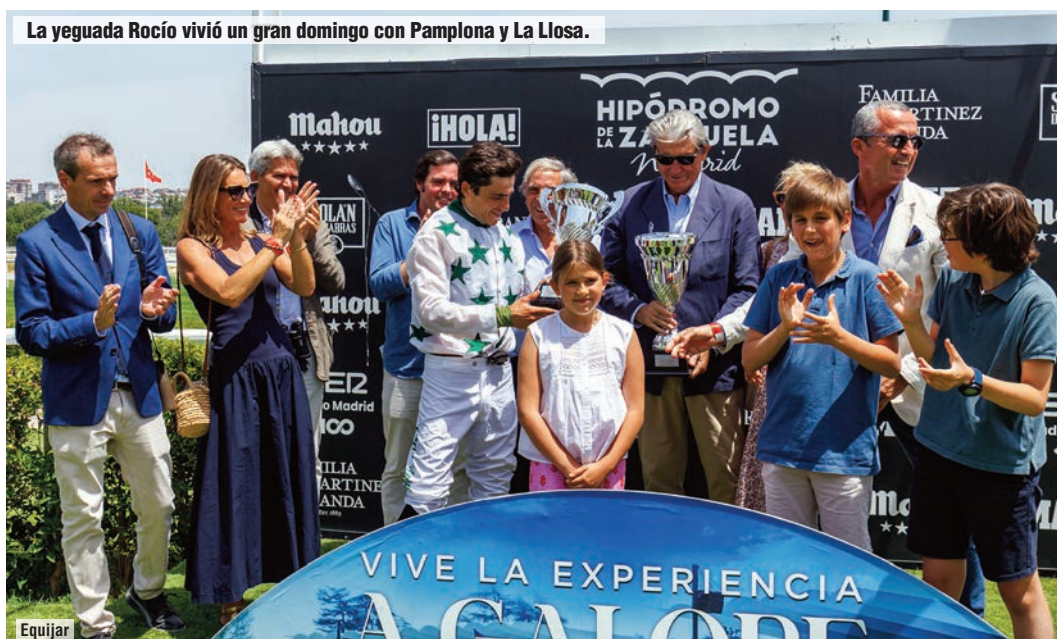
La yeguada Rocío vivió un gran domingo con Pamplona y La Llosa.

Multa de 100 € a S. de Sousa por usar la fusta cuando claramente no podía mejorar su posición.