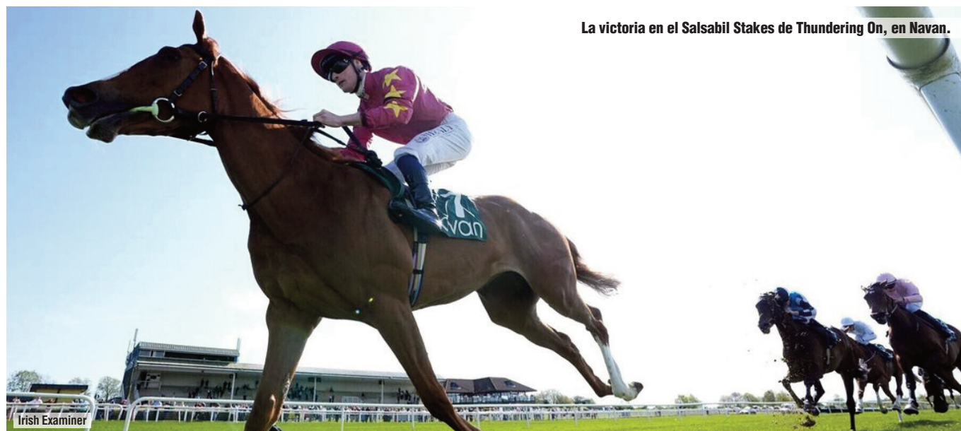
La victoria en el Salsabil Stakes de Thundering On , en Navan.