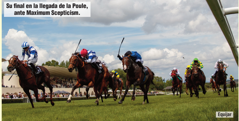
Su final en la llegada de la Poule, ante Maximum Scepticism.