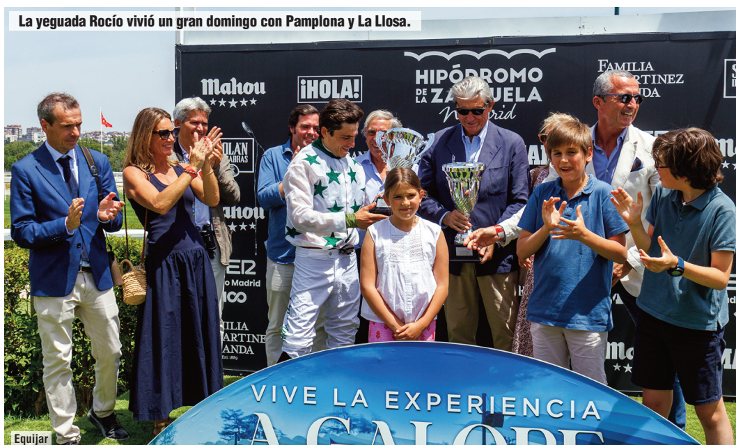
La yeguada Rocío vivió un gran domingo con Pamplona y La Llosa.

Multa de 100 € a S. de Sousa por usar la fusta cuando claramente no podía mejorar su posición.