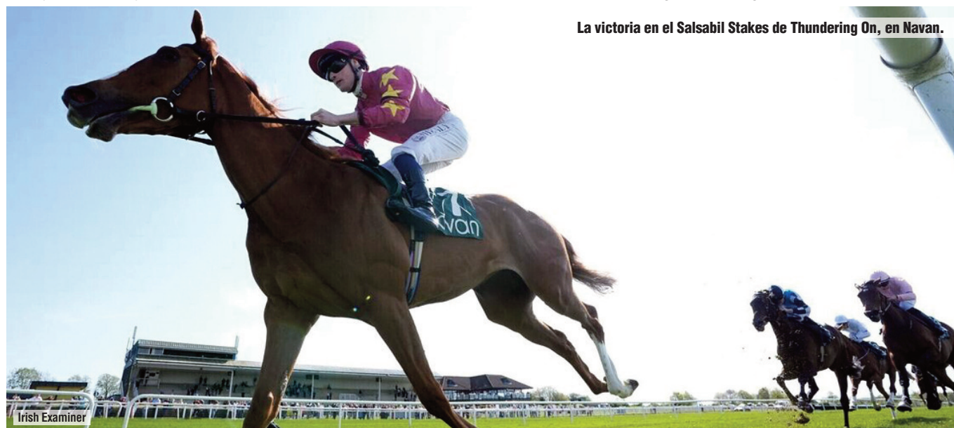
La victoria en el Salsabil Stakes de Thundering On , en Navan.