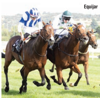
Delante de Madid y Octans en el Ruban .

El representante de la cuadra Mediterráneo regresa a Madrid para disputar el premio Jockey Club (ex Urquijo) con un punto más de valor que cuando ganó el pasado otoño el Ruban ; además, en primavera ha disputado cuatro carreras en Francia con dos terceros, un segundo y un quinto en la reaparición. Siempre montado por Soumillon , su mejor actuación la completó el 7 de abril en Deauville en el prix Cor de Chasse, un Listed de 1.100 metros en el que acabó tercero con valor 46.