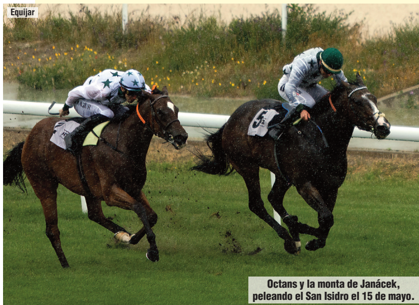
Octans y la monta de Janáček, peleando el San Isidro el 15 de mayo.