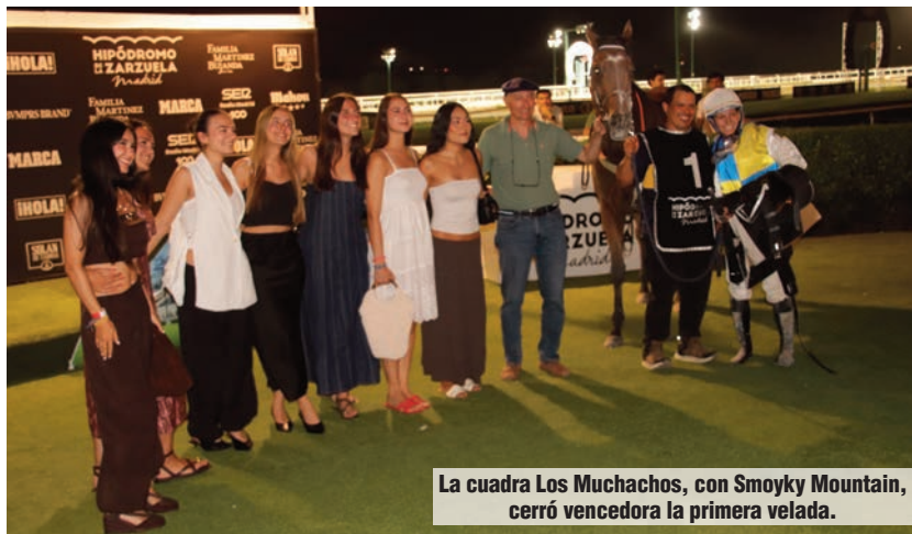
La cuadra Los Muchachos, con Smoky Mountain, cerró vencedora la primera velada.