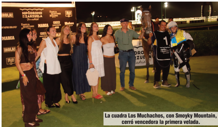
La cuadra Los Muchachos, con Smoky Mountain, cerró vencedora la primera velada.