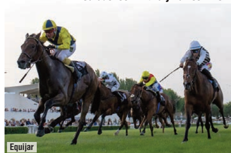
El Carudel con Witiza y Vamos Niño.

Los corredores nacionales se batan cada vez más en franca minoría, pero su temporada de primavera en los grandes premios 2026 ha resultado especialmente meritoria. Witiza y Vamos Niño coparon la milla del Carudel, Madrid se proclamó mejor sprinter en el Jockey Club y La Llosa (con nacimiento francés, pero origen español, al igual que la ganadora del Baldoria, Annie's Song ) lideró a las fondistas clásicas en el Oaks. Madrid (42.000) y Witiza (39.800 euros) son los caballos de edad más rentables sólo superados por Coetzee y no hay tres años con mayor valor (45) que el nacional Imagine , adquirido en la subasta de la Asociación de Criadores.