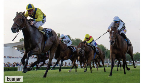
El Carudel con Witiza y Vamos Niño.

los caballos de edad más rentables sólo superados por Coetzee y no hay tres años con mayor valor (45) que el nacional Imagine , adquirido en la subasta de la Asociación de Criadores.