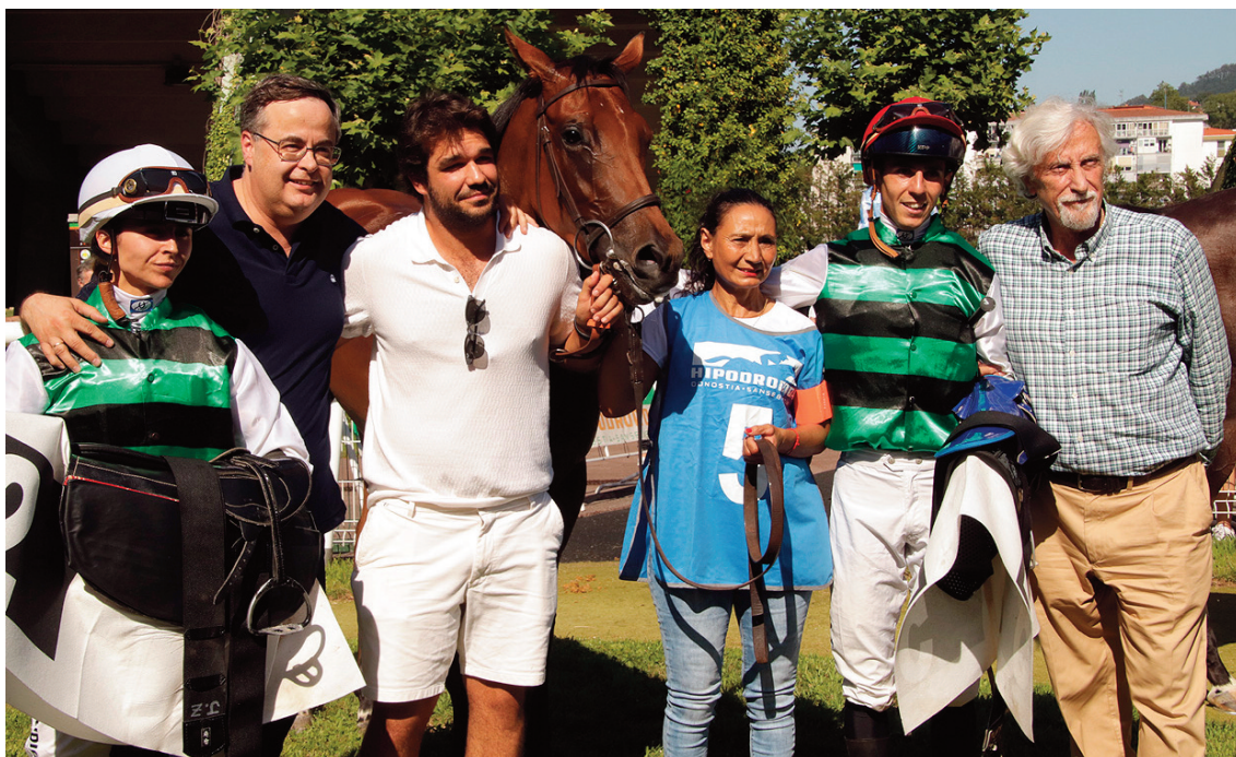
El equipo de Martul, primero y tercero en la carrera de potros con Narcea (foto) y Katxorro.

Se reciben certificados veterinarios que indican que Aimar y Austria se encuentran herradas solamente de las extremidades anteriores debido a dificultades para su herraje.