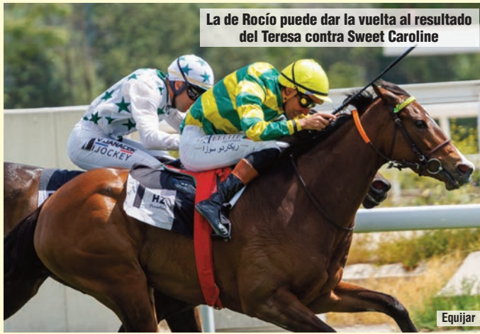
La de Rocío puede dar la vuelta al resultado del Teresa contra Sweet Caroline