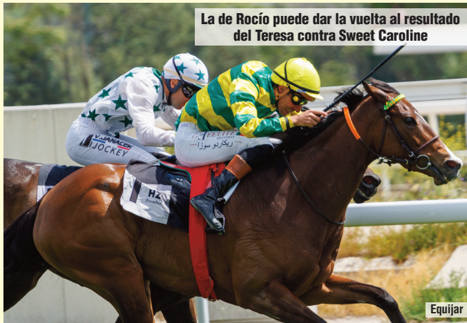
La de Rocío puede dar la vuelta al resultado del Teresa contra Sweet Caroline